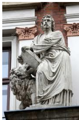
Saint Marc Évangéliste