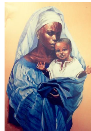
Photo Notre Dame d'Afrique