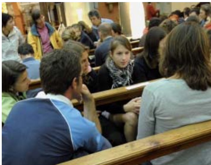
Clic - Alain Prings

Le développement de l'analyse narrative a largement renouvelé l'exégèse des textes bibliques, sans pour autant disqualifier le recours à la méthode historique. La journée d'herméneutique biblique sera, cette année, l'occasion d'évaluer les richesses propres à chacune des deux approches, tout en montrant la fécondité de l'analyse narrative, notamment à travers des exemples tirés du quatrième évangile.