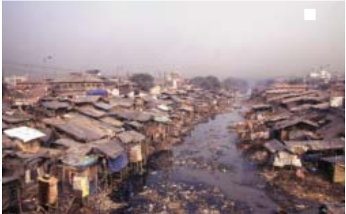
Cerc - Alain Pirognes

15. Cette conscience accompagne encore aujourd'hui l'action de l'Église envers les pauvres, en qui