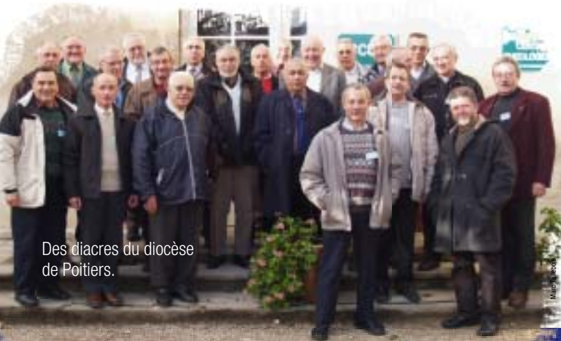
Des diacres du diocèse de Poitiers.

D'une manière générale, le diacre apparaît comme une figure ecclésiale dans des relations de proximité. Il a une fonction d'arti-