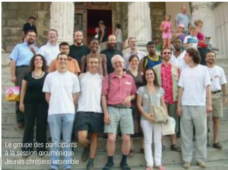
Le groupe des participants à la session œcuménique Jeunes chrétiens ensemble

Que retenir d'une telle semaine? Bien plus de choses sans doute que ces lignes ne permettent de l'écrire. Qu'en dire alors? Un espoir au milieu des inquiétudes, car des inquiétudes, ici comme ailleurs, sont palpables. Elles sont parfois liées à l'hostilité, au sein de nos diverses confessions, car ce dialogue exigeant qui ne peut se réaliser que sans faux-semblants et avec honnêteté (comment pourrait-il en aller autrement alors qu'il est question de foi et de religion?) implique de réinterroger ce que l'on pense parfois trop vite comme "allant de soi". Elles sont aussi liées au contexte actuel où ne se répercutent souvent, notamment médiatiquement, que deux résonances: intégrisme et désertion des pratiques religieuses. Ces inquiétudes sont également générées par un sentiment