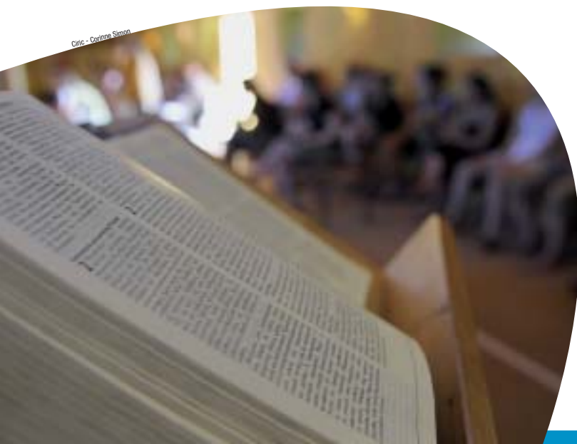
Centre - Centre Simon

Cette année, le Centre théologique publiera régulièrement dans Eglise en Poitou des fiches bibliques présentant les textes du dimanche... une occasion de partage en petits groupes, pour réfléchir et nourrir la foi, pour préparer aussi la liturgie du dimanche.