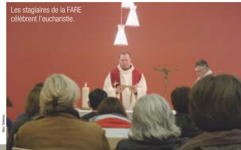
Les stagiaires de la FARE célèbrent l'eucharistie.

Un groupe de stagiaires va débiter la formation en janvier 2009. Deux sessions auront encore lieu d'ici là pour le groupe qui termine sa troisième année de formation. Les procédures d'appel sont actuellement en cours dans chacun des diocèses.