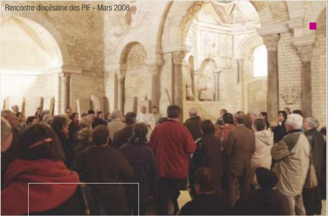
Rencontre diocésaine des PIF - Mars 2008