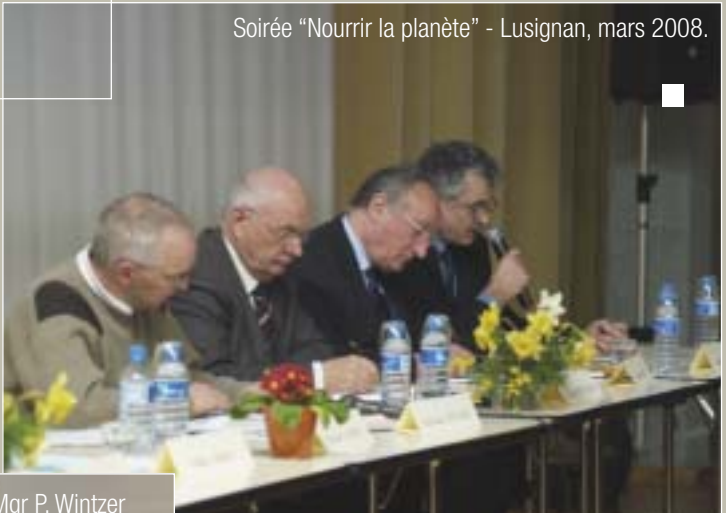
Soirée "Nourrir la planète" - Lusignan, mars 2008.