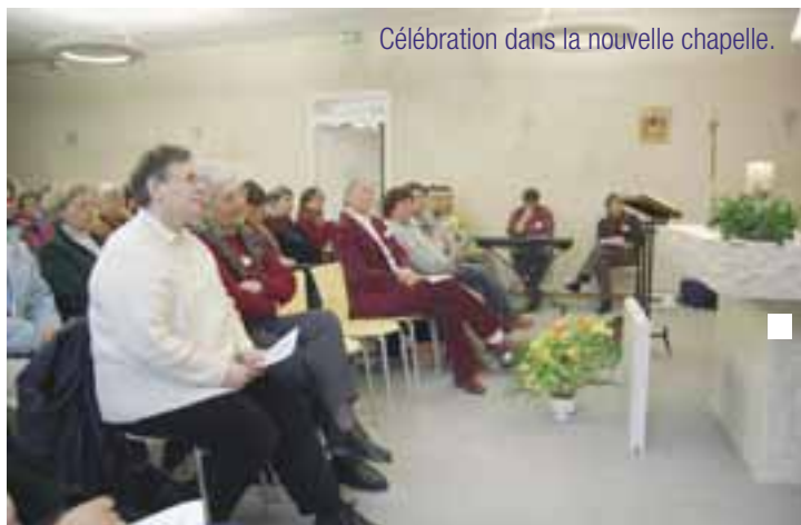
Célébration dans la nouvelle chapelle.