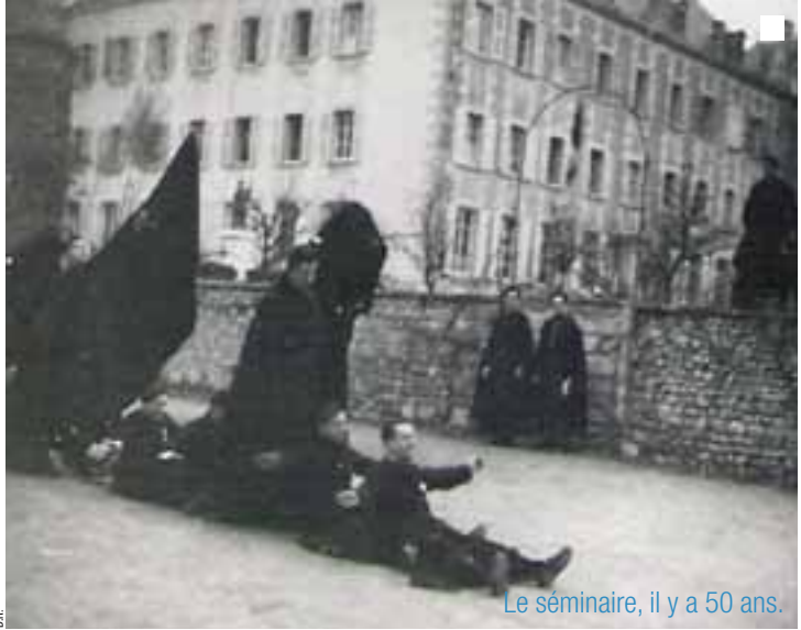
Le séminaire, il y a 50 ans.

Depuis plus de 1 000 ans, ce lieu chargé d'histoire a vécu de nombreuses transformations... et ce n'est pas fini. En voici les grandes étapes.