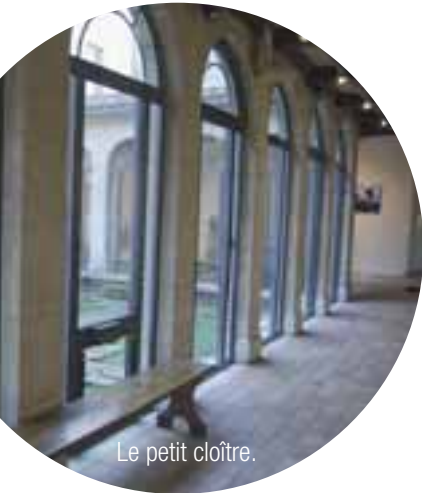
Le petit cloître.