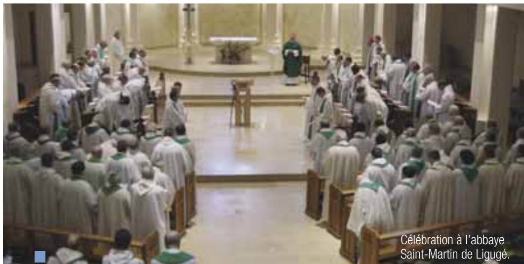
Célébration à l'abbaye Saint-Martin de Ligugé.