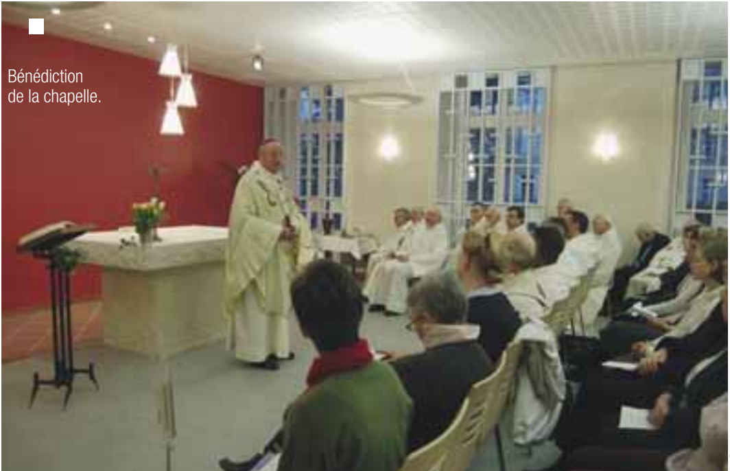
Bénédition de la chapelle.

La cérémonie commença par la bénédiction de l'assistance, puis des murs. Le signe de l'eau, comme celui du baptême, rappelle le début de la vie chrétienne. Lors de l'homélie, Mgr Rouet a souhaité redéfinir ce qu'est cette grande maison et la place de sa chapelle en son sein: "Cette chapelle est un lieu de prière, de silence, où l'on se ressource. Elle vous est remise,