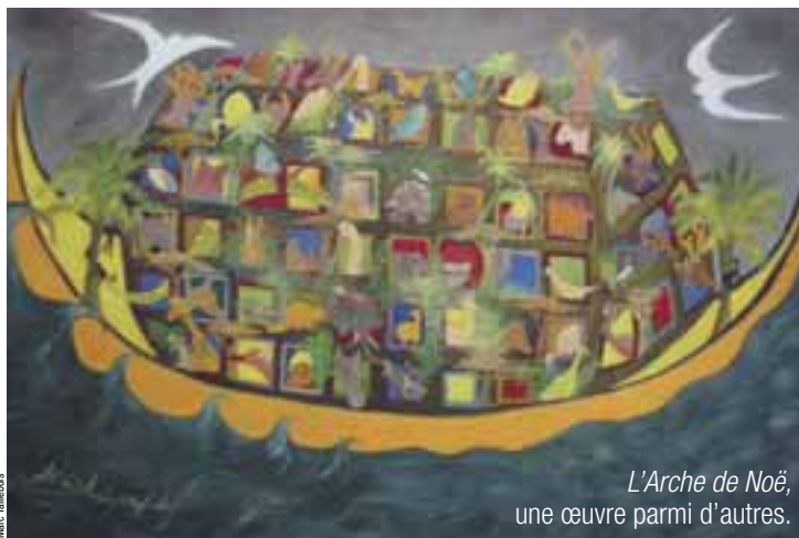
L'Arche de Noë, une œuvre parmi d'autres.

le signe de l'humanité. Au fond, quelle est la valeur de l'art sinon de nous dire, de nous suggérer, d'évoquer devant nos yeux ce vers quoi nous tendons sans toujours savoir exactement ce que c'est? Donc le but de l'art n'est pas d'abord de montrer ce qui est, mais de tenter de nous dire l'invisible qui anime ce qui est. Ainsi, il nous entraîne à aller plus loin et, en ce sens, il opère une prise de position contre tout ce qui, dans la vie d'un être ou d'une société, entrave cette marche, bloque l'avancée.